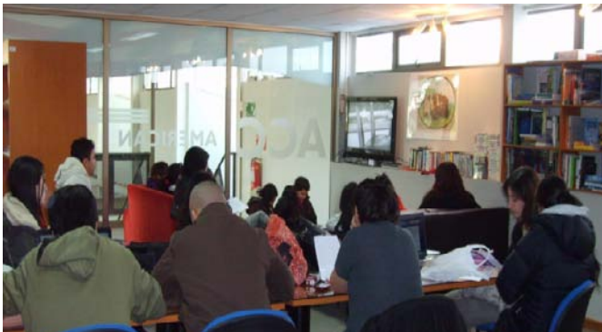
Asistentes tomando apuntes del documental para incluir la información en su investigación, AC UMAG, Punta Arenas.