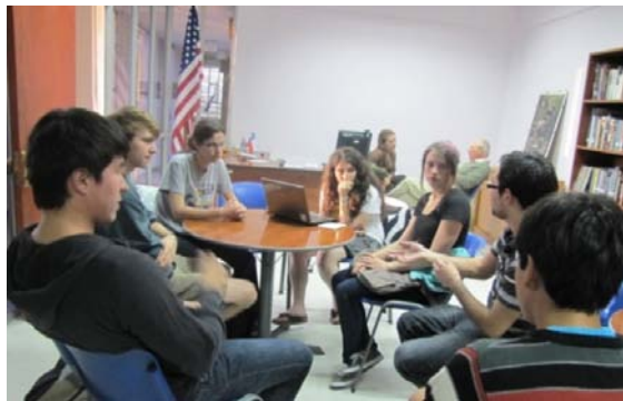
Grupo de conversación en el American Corner UTA, Arica.

Esta actividad se realizó con el apoyo de los estudiantes de University of Northern Iowa (UNI).