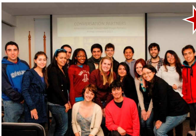
Fotografía grupal durante la actividad de finalización Conversation Partners. UDP, Santiago.

El martes 26 de junio se realizó en dependencias de la Facultad de Comunicación y Letras de la Universidad Diego Portales (UDP) en Santiago, la ceremonia de finalización y entrega de certificados a los participantes, de la primera versión de la iniciativa Conversation Partners.