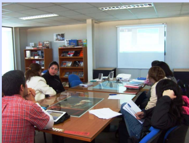
Asistentes a los webinars en AC UMAG, Punta Arenas.

Más información y recursos para profesores de inglés en: http://shapingenglish.ning.com/