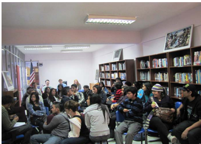
Asistentes a la exhibición Stone Wall Uprising . American Corner UTA, Arica.

Estas iniciativas se realizan en el contexto de los lineamientos actuales del gobierno de EE.UU. y específicamente a partir de la postura del presidente de EE.UU. Barack Obama, en pro de los derechos de las comunidades LGBT. Lo anterior se ha traducido en acciones tales como: asegurar una justicia para todos en virtud de la Ley Matthew Shepard y James Byrd, Jr., la Ley de Prevención de Delitos Inspirados en Odio (por prejuicios), la ampliación de los derechos de visita hospitalaria para pacientes LGBT y sus seres queridos, y la derogación de la política "No Preguntas, No Digas", gracias a la cual los estadounidenses gays, lesbianas y bisexuales pueden servir a su país abierta y honestamente, sin temor a perder sus empleos debido a la elección de las personas a quienes aman, entre otras acciones.