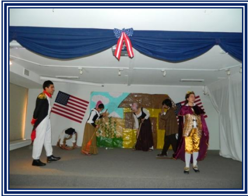
Estudiantes del Colegio Cristiano Emmanuel, ganadores del primer lugar- durante su actuación.

El pasado miércoles 27 de julio se realizó en el auditorio del Campus Santiago de la Universidad de Talca la final del concurso “El Camino hacia la independencia de Los Estados Unidos: Dos Miradas” organizado por la American Academy of Science and Technology (AAST) con motivo de la celebración del 4 de julio 2011.