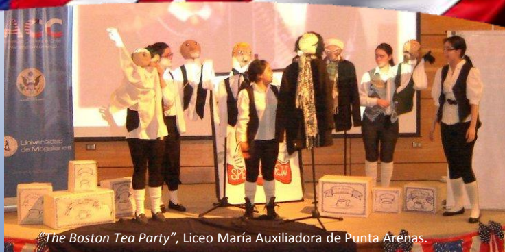
"The Boston Tea Party", Liceo María Auxiliadora de Punta Arenas.