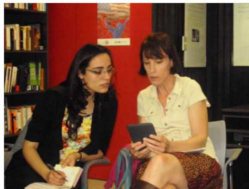
Participantes de la actividad en AC UDP, Santiago.

La actividad se realizó en las dependencias del “Rincón Americano”, en el marco de la donación que realizó la Embajada de los Estados Unidos en Santiago de Chile, de estos dispositivos tecnológicos a los usuarios de este programa, para que los utilicen en futuras actividades. Se espera que con el uso de esta herramienta y la creación de actividades atractivas, este AC pueda contribuir –de alguna manera- a la democratización de las nuevas tecnologías de la información.