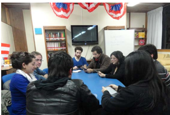
Integrantes del Reading Club. American Corner UACH, Valdivia.

El 6 de septiembre se dio inicio a la actividad Reading Club en el American Corner de la Universidad Austral de Chile (UACH), ubicada en la Biblioteca Central de esta casa de estudios de Valdivia.