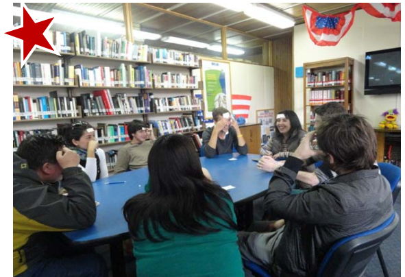
Participantes en los grupos de conversación. American Corner Uach, Valdivia.

Durante las sesiones, los asistentes tratan diversos temas y organizan actividades lúdicas para mejorar su manejo del idioma inglés y para crear lazos de amistad.