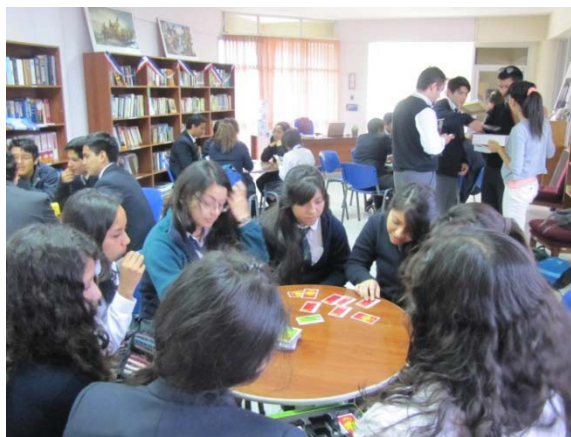
Participantes de la actividad en AC UTA, Arica.

Ésta es una de las múltiples actividades que ofrece este American Corner y que apoyan además la práctica del idioma inglés de manera lúdica.